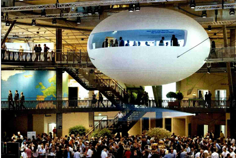
Mit ihrer spektakulären Architektur bietet die Umwelt Arena auch den perfekten Rahmen und ideale Räumlichkeiten für Veranstaltungen.

Themen-Nr.: 520.007 Abo-Nr.: 1085939 Seite: 36 Fläche: 161'073 mm 2